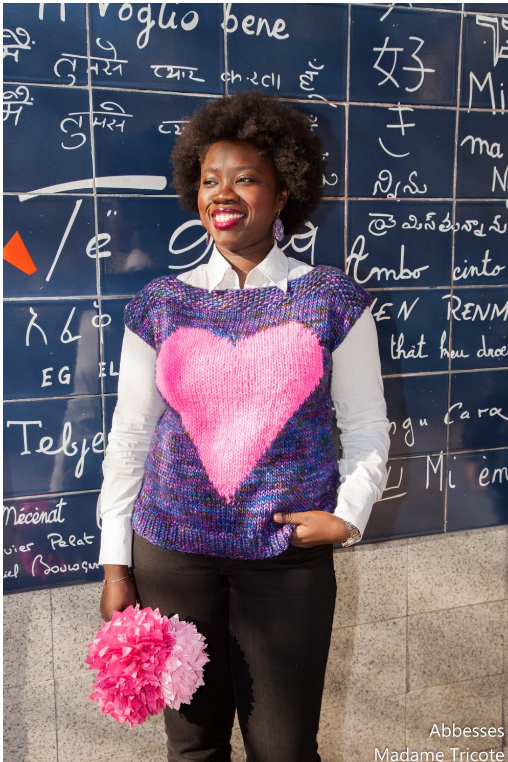
Abbesses Madame Tricote

J'ai voulu nommer ce pull en hommage à un lieu symbolique de l'amour à Paris et c'est dans mon quartier, aux Abbesses que se trouve le fameux mur des "Je t'aime" en toutes les langues que vous pouvez voir en décor sur les photos.