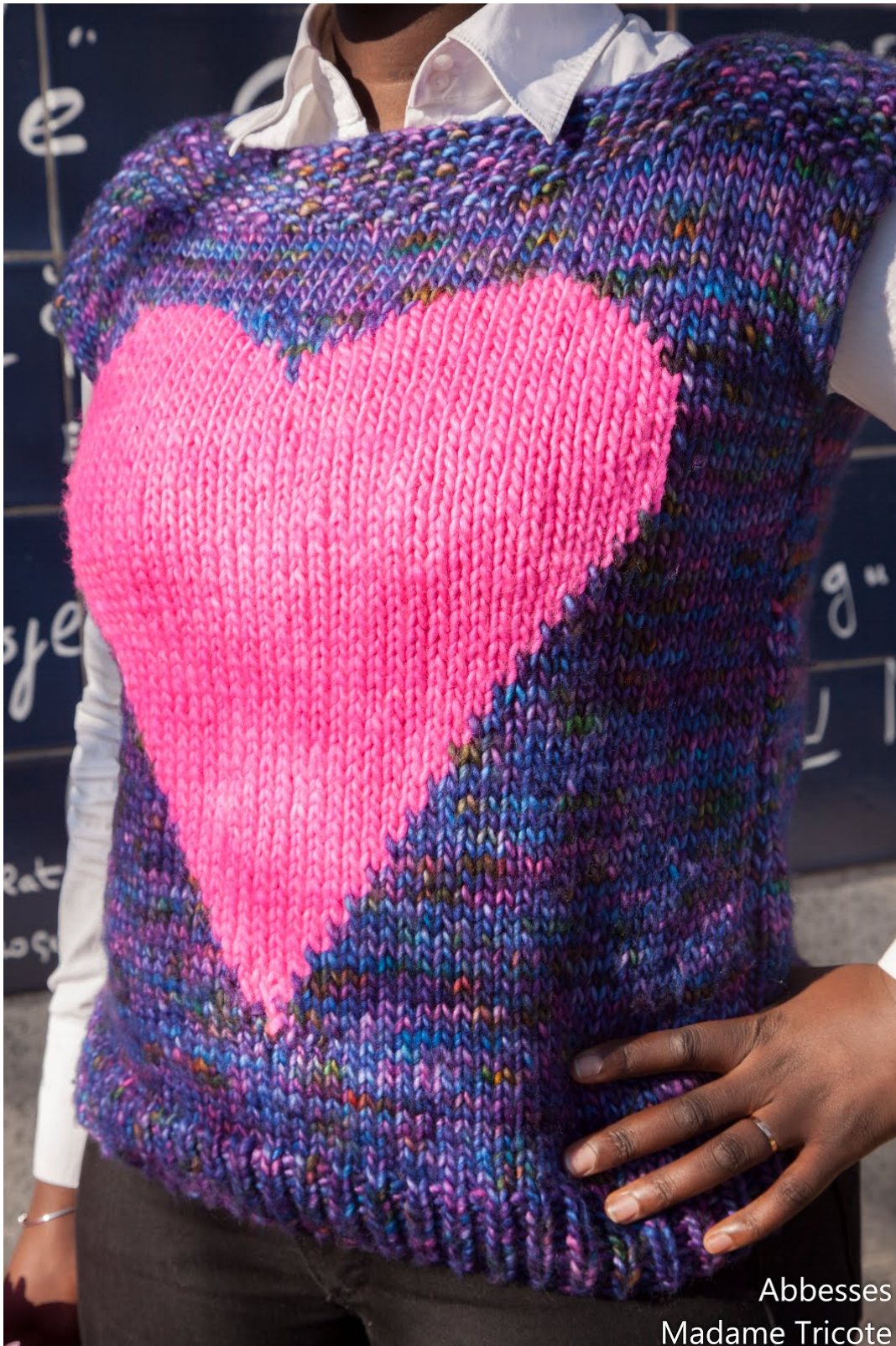
Abbesses Madame Tricote

Abbesses un petit pull sans manches très rapide à tricoter et qui conviendra très bien aux débutantes hésitant à se lancer dans la réalisation d'un vêtement.